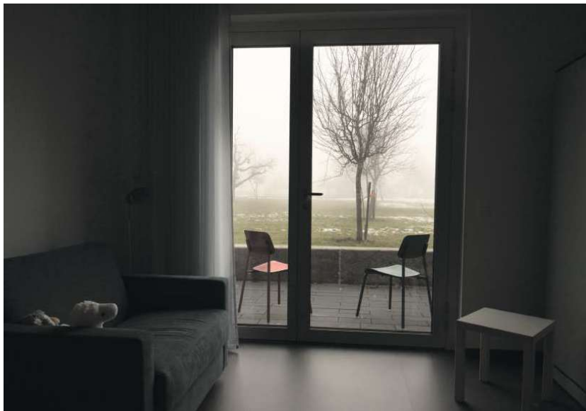
Die Stiftung Kinderhospiz Schweiz hat lange nach einem Grundstück gesucht. Unweit des Greifensees in Fillanden wurde sie findig.